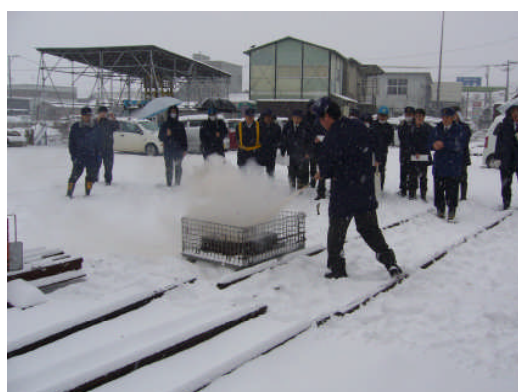
車両火災を想定した教育訓練