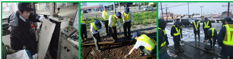
・7000形車両故障の処置