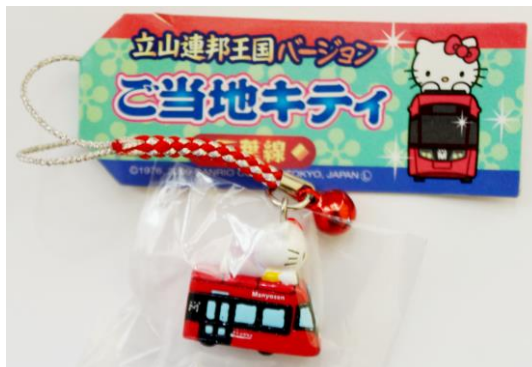
ご当地キティ万葉線