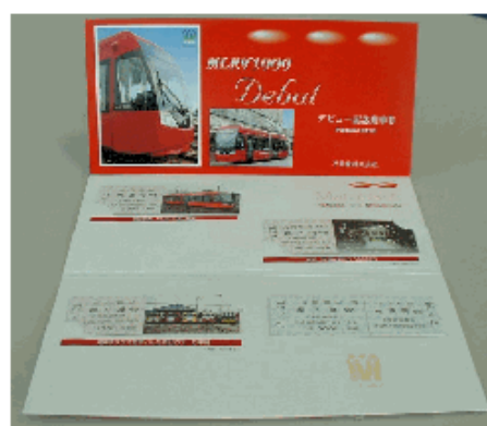
MLRV1000デビュー記念乗車券 1セット 1,000円