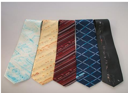
万葉線オリジナルネクタイ