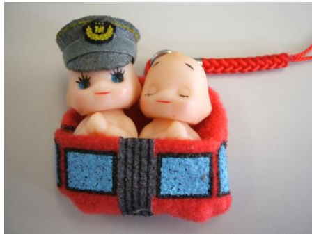
愛トラムキューピー④