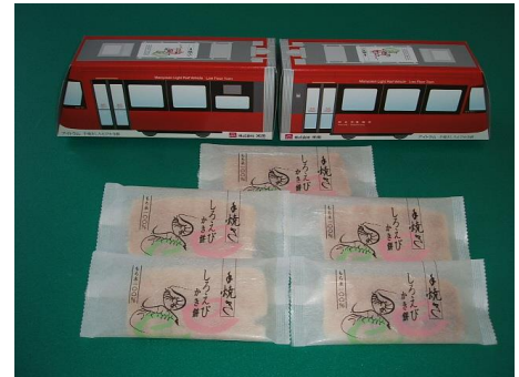
アイトラム手焼きしろえびかき餅 外箱は高岡駅行きと越ノ瀨行きの 2種類があります。