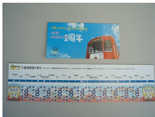
万葉線電車開業 1周年回数券 1,000円