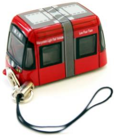
走る！万葉線キーホルダー