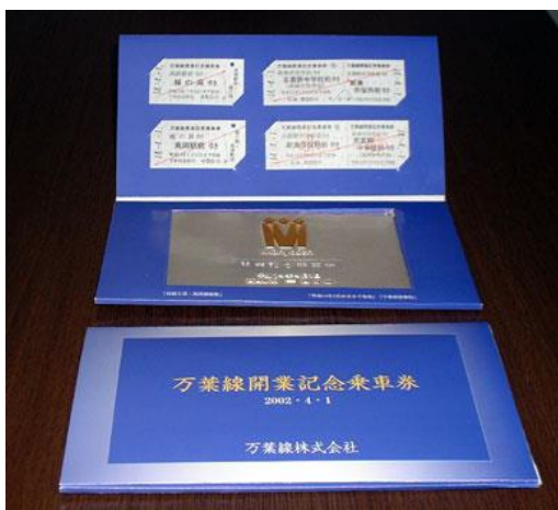
万葉線開業記念乗車券 1セット3,000円