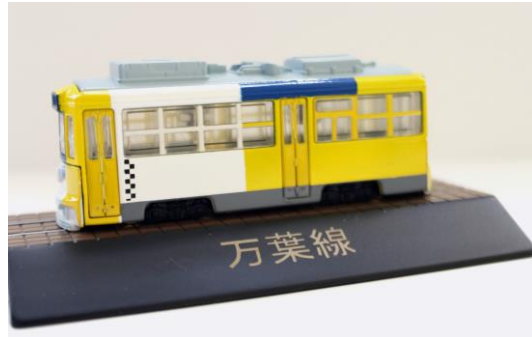
トラムズダイキャストモデル 万葉線⑤