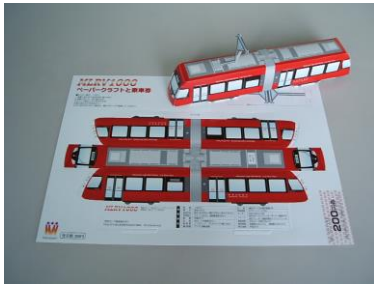
MLRV1000・アニマル電車 ペーパークラフト(乗車券付き)