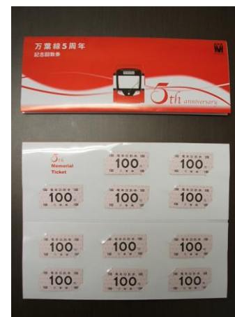
万葉線5周年記念回数券 1セット 1,000円