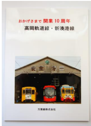
開業10周年記念写真集⑭