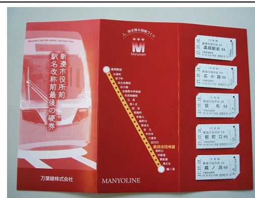
新湊市役所前駅名改称前 最後の硬券 1セット1,300円