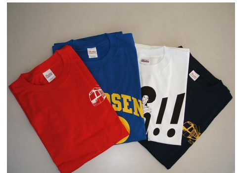
万葉線オリジナル T シャツ