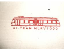
ショッピングバッグ⑦