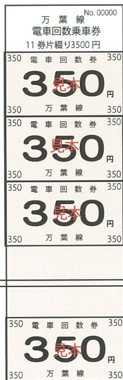
普通回数券 (11 枚つづり)