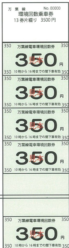
環境回数券 (13 枚つづり)

80 円・100 円・130 円・150 円・180 円・200 円・250 円・300 円・350 円の各種がございます。