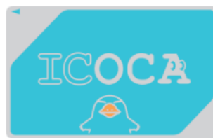
※カード表面には万葉線の定期券情報は表示されません。