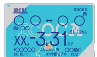
※カード表面には他社の定期券情報が表示されます。